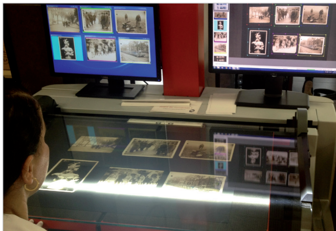
Numérisation par des spécialistes formés.

s'ajoutent en effet désormais un savoir-faire reconnu dans le transport et le traitement des supports anciens les plus diversifiés (ouvrages reliés, registres, liasses, plans techniques, affiches, médailles, sceaux, textiles...), en passant par leur indexation (manuelle ou par vidéocodage, ajout d'un code à barres ou catalogage...).